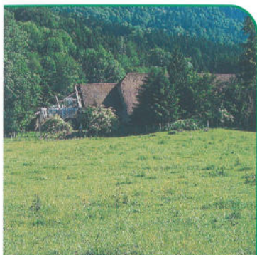
Le mas d'Aiguenoire.

La vallée de Chartreuse a connu une intense activité autour du travail du bois. Celui-ci était travaillé dans des tourneries, des tabletteries, des scieries qui produisaient des produits de toute sorte. Cette activité se perpétue aujourd'hui encore dans la papeterie, et surtout par une dynamique activité artisanale avec notamment la fabrication de cannes de marche, de la tournerie et de la tabletterie.