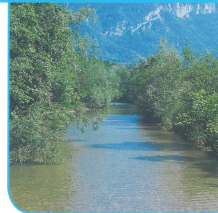
Le Guiers mort

Distance du parcours : 11,4 km Altitude minimale : 384m Altitude maximale : 459m Durée du parcours : 4h - VTT 1h30 ● Niveau de difficulté : facile VTT : ● IGN : TOP25 3333 OT "Chartreuse Nord"