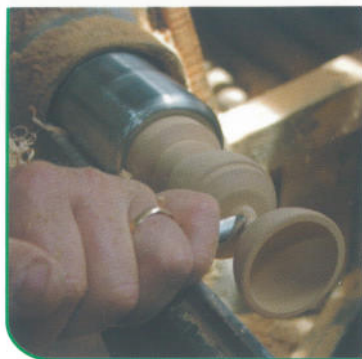
Tournage du bois.

A l'est votre horizon est barré par les hautes falaises calcaires de la bordure occidentale du massif de la Grande Chartreuse, de ces escarpements s'échappent les deux Guiers : le Guiers Vif, qui sort du bassin d'Entremont par les impressionnantes gorges du Frou et le Guiers mort, venu de St-Pierre de Chartreuse. Ce grand quadrilatère limité par les "deux Guiers" fut l'objet d'un litige qui dura plusieurs siècles entre la France et la Savoie, car lors de la mise en place de frontières effectuée en 1355, la frontière fut fixée au Guiers, sans qu'on ait précisé si, en amont de leur confluent, il s'agissait du Guiers Vif ou du Guiers mort.