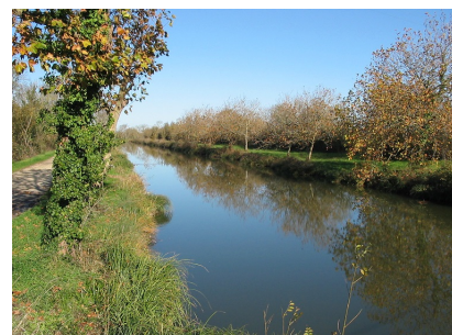
Le canal de Charras