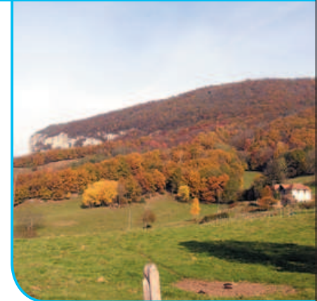
Montagne de Champagneux

IGN : TOP25 3232 ET "Belley St-Genix / Guiers"