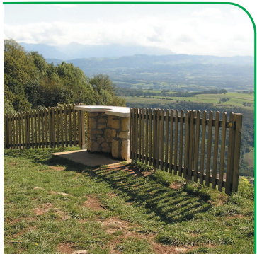
Belvédère du Crozet à Saint-Maurice

Suivre l'itinéraire décrit ci-dessus jusqu'au panneau "le Terrailier". Prendre ensuite la direction de Cupied. Depuis Cupied, faites un aller-retour au site panoramique des fils (25 min. aller). Site en falaise, surveillez vos enfants. De Cupied vous pouvez rejoindre le hameau des Rives puis le GR65 qui vous guidera au village de Saint-Maurice puis à Grésin.