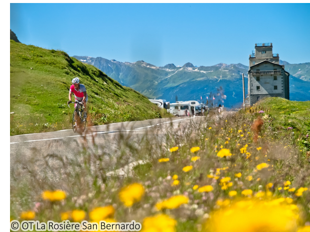
© OT La Rosière San Bernardo

L'un des grands cols les plus agréables à escalader. La pente régulière et les lacets plats vous donneront une impression d'aisance tout en vous propulsant à plus de 2000 m d'altitude ! Vue exceptionnelle sur les versants glaciaires de la Vanoise