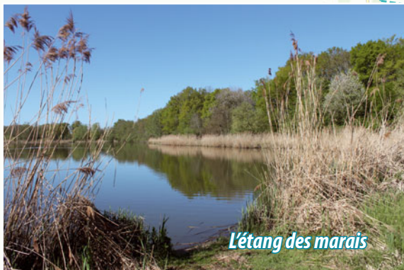
L'étang des marais

Départ : parking de la salle polyvalente