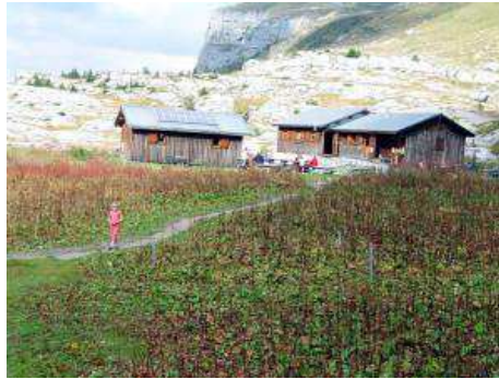
les chalets du refuge de Sales

Plusieurs unités composent le refuge : un chalet accueil, un chalet sanitaire et deux chalets dortoirs, ceci afin de limiter l'emprise de l'avalanche et de mieux protéger les constructions derrière les barres rocheuses.