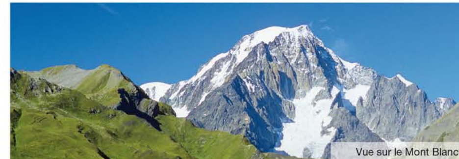
Vue sur le Mont Blanc