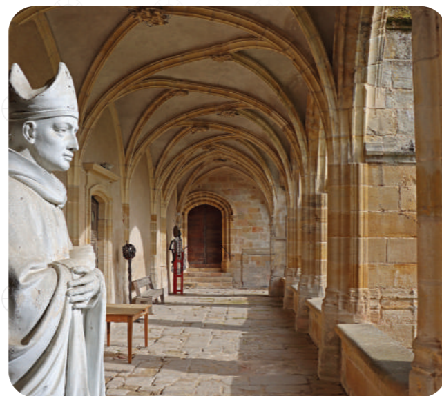
Cloître de Souvigny