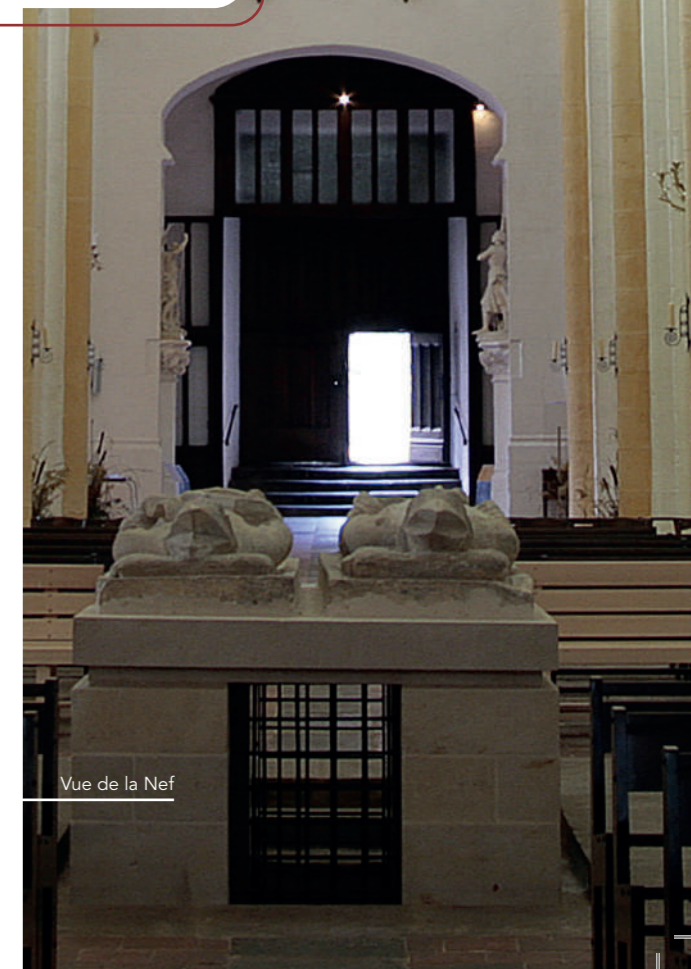
Vue de la Nef