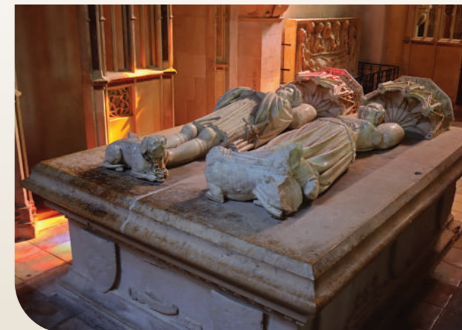
La chapelle Vieille