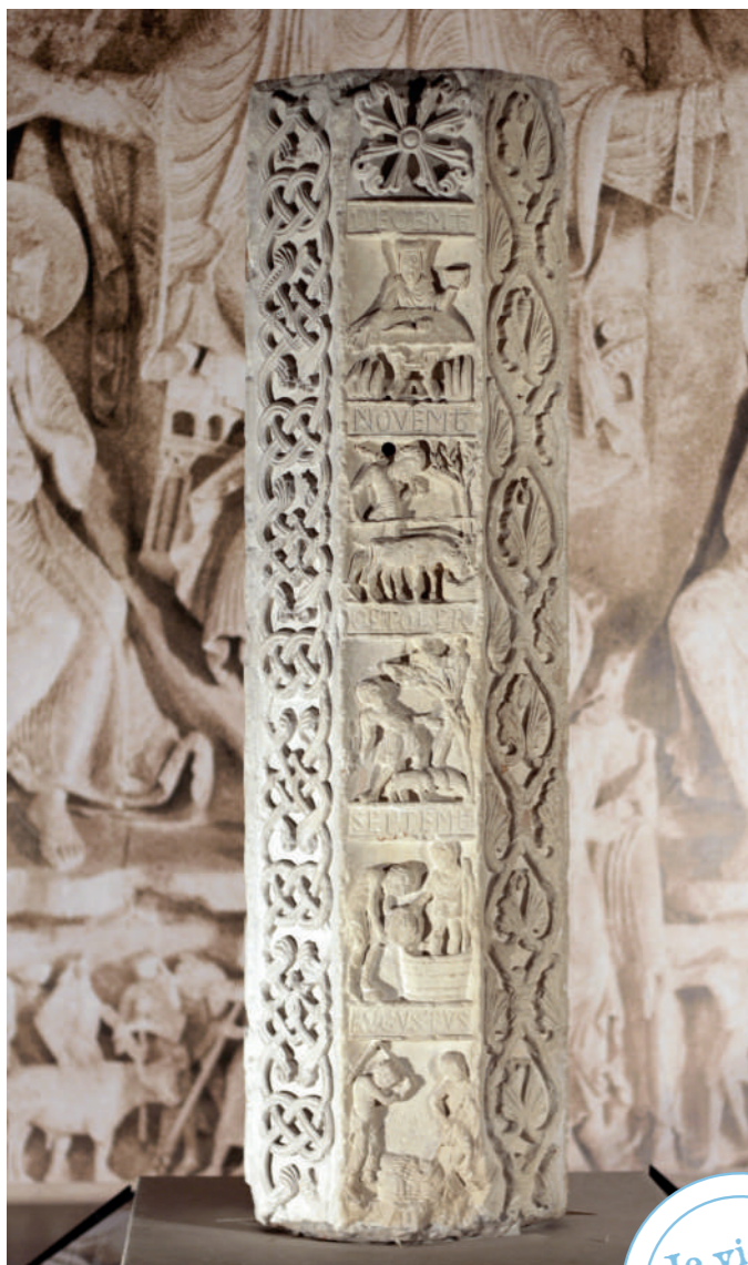
La colonne du Zodiaque