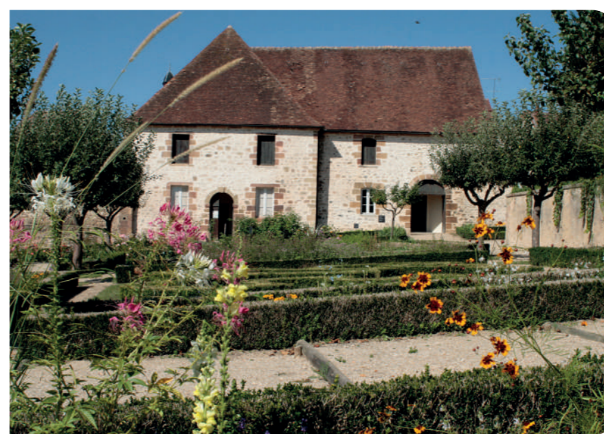
Jardin et musée