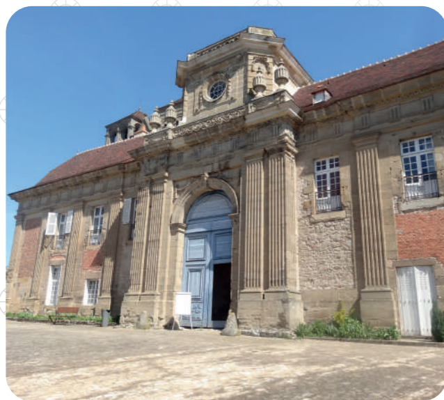
Prieuré de Souvigny