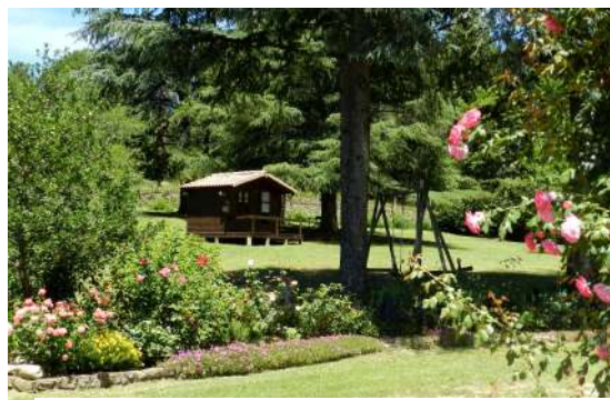
Parc clôturé (portail électrique)