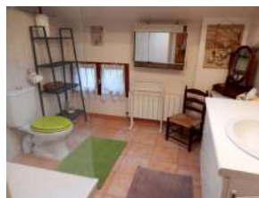
Salle d'eau + WC