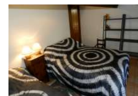
Chambre Lit en 140 + Lit en 110