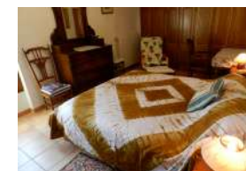
Chambre climatisée Lit en 160