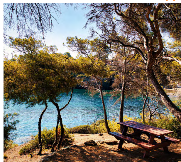
LA CALANQUE BONNE EAU