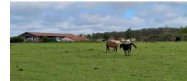
Centre équestre le Ruisseau Blanc à Nozay