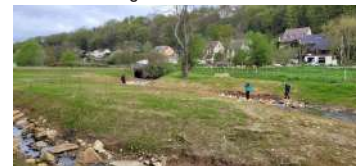
Le Rouillon à Saulx