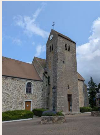
Église Saint Germain de Nozay

Le mobilier conserve des fonts baptismaux en pierre, quatre stalles sculptées du XVIII e siècle, une cloche baptisée « Amandine » (1842, 780 kg) et une horloge installée en 1960.