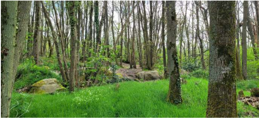
Bois du Rocher