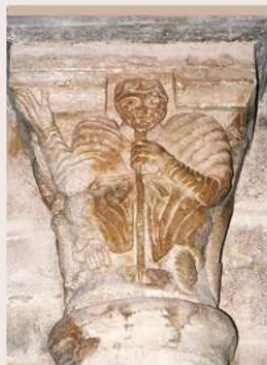
CHAPITEAU SAINT-JACQUES, ÉGLISE DE FLEURIEL

en France. Les deux animaux rappellent deux légendes qui se rattachent au pèlerinage de Compostelle : la légende du magicien Hermogène, converti par l'apôtre du Christ, et celle du « Pendu dépendu » que répandaient au Moyen Âge dans toute l'Europe les pèlerins de Saint-Jacques-de-Compostelle. Voir aussi la peinture murale de l'église de Saulcet.