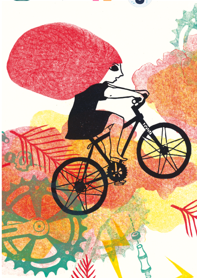
ILLUSTRATION : ÉVELYNE MARY

* ADECC : Agence du Développement de l'Économie Culturelle du Couserans.