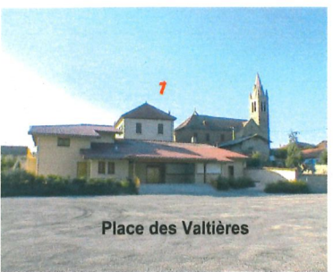
Place des Valtières