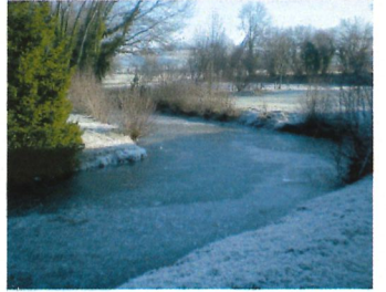
Etang du Vivier