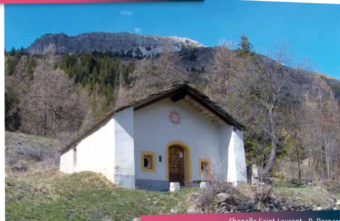
Chapelle Saint-Laurent - R. Bernard

Mais quels sont ces petits casques de couleurs accrochés au-dessus de votre tête ? Ce chemin mène décidément à tous les plaisirs de la montagne ! Les amateurs de via ferrata ne vous contrediront pas. Ces falaises sont aussi un paradis pour le gypaète qui vole souvent par là.