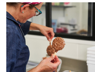
Eclat des Cimes