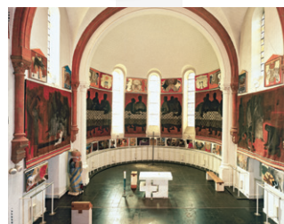
Musée Arcabas en Chartreuse

Informations et autres idées de visites sur destinationchartreuse.fr/pepites ou sur la carte touristique (disponible gratuitement dans les Offices de Tourisme du massif).