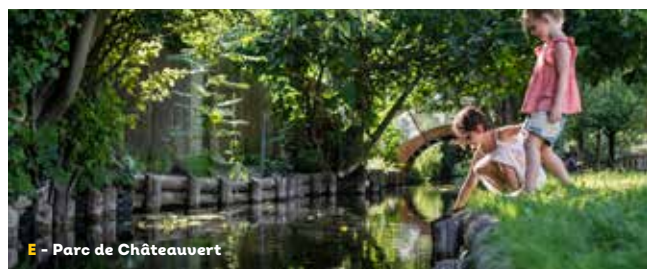
E - Parc de Châteaupert

Cette balade vous emmènera à la découverte du quartier de Châteaupert où vous pourrez admirer les sources en provenance du Vercors, dont la fontaine des Malcontents, ou des jardins partagés et des zones humides protégées. Vous apprécierez la fraîcheur de cette balade bucolique et apercevrez une faune importante (grenouilles, libellules, truites) et une flore abondante (callitriches, potamots, rubanier).