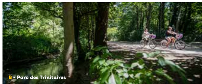
B - Parc des Trinitaires

Cette balade vous permettra de longer plusieurs canaux, mais aussi de relier 4 des principaux espaces naturels de la ville : cette coulée verte à travers les parcs Jouvet, des Trinitaires, Marcel Paul et de l'Épervière, conduira vos pas jusqu'au port de plaisance. Vous apprécierez la vue depuis la marina sur la montagne ardéchoise. Le retour se fera en empruntant une portion de la Via-Rhône, cet itinéraire qui longe le Rhône entre le lac Léman et la Méditerranée.