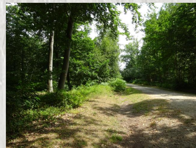
La forêt de Montceaux

A la découverte de Varreddes et Germigny-l'Évêque, anciennes résidences d'été des évêques de Meaux. Pigeonnier, tourelle et terrasse rappellent aujourd'hui les vestiges d'un château édifié par le prédécesseur de Bossuet.