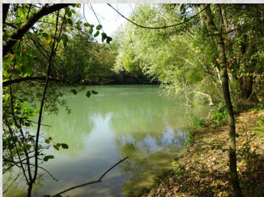
La Marne

Ce remarquable musée ouvert en 2011, présente l'originalité d'être plus un lieu de compréhension que de recueillement. Une mise en regard des batailles de la Marne de 1914 à 1918 montre les bouleversements qui ont fait passer le monde du XIX ème au XX ème siècle. Le musée renvoie aussi vers les sites du nord seine-et-marnais où subsistent des témoignages de la Première Guerre mondiale.