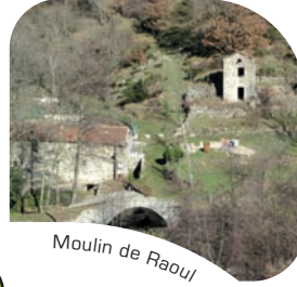
Moulin de Raoul

Attention ! les châtaigneraies sont exploitées : merci de respecter les cultures et de ne pas ramasser de fruits.