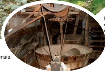
Moulatou du Moulin de Raoul