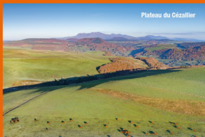
Plateau du Cézalier