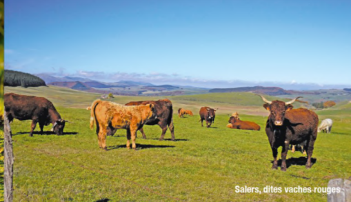
Salers, dites vaches rouges