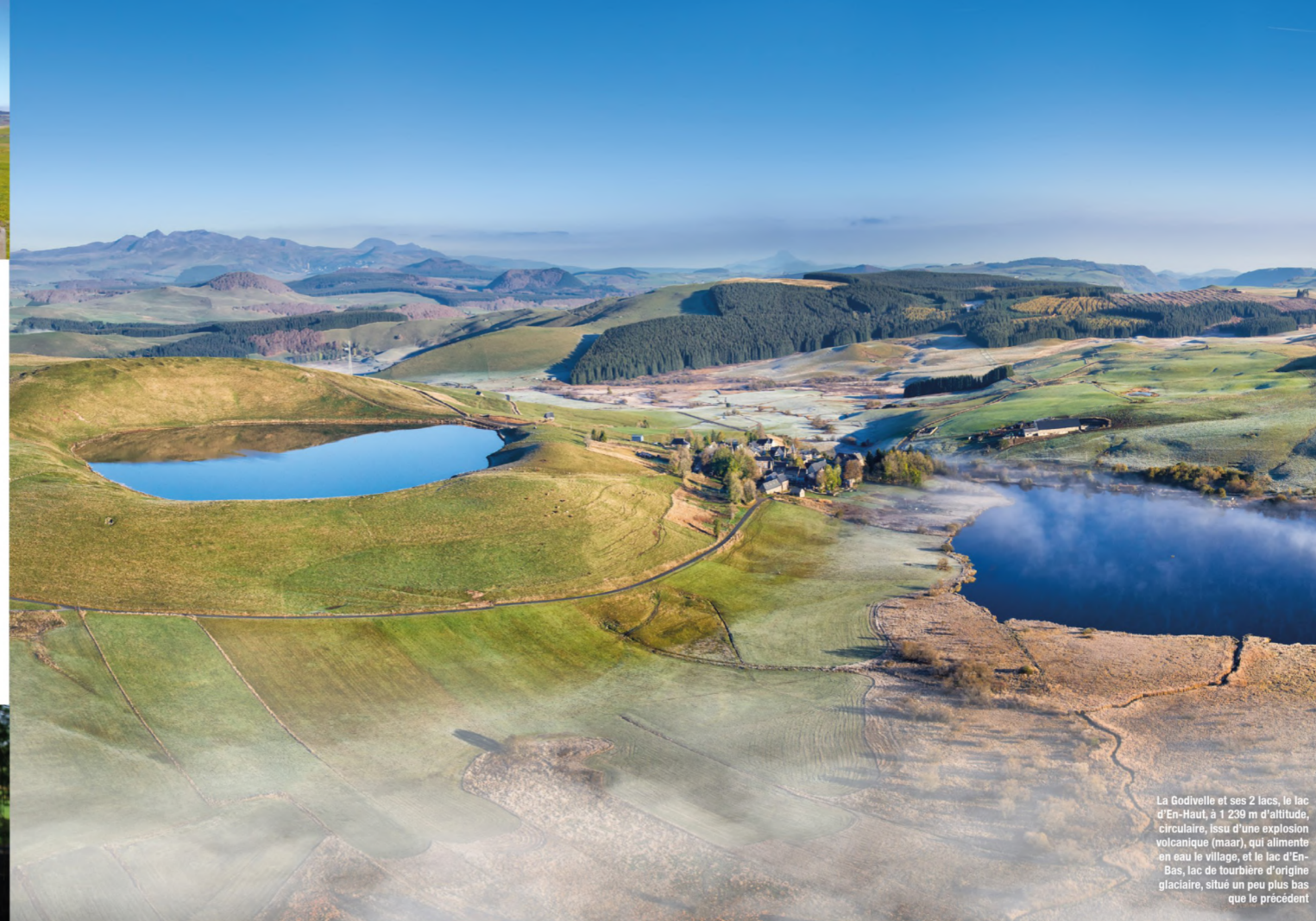
La Godivelle et ses 2 lacs, le lac d'En-Haut, à 1 239 m d'altitude, circulaire, issu d'une explosion volcanique (maar), qui alimente en eau le village, et le lac d'En-Bas, lac de tourbière d'origine glaciaire, situé un peu plus bas que le précédent