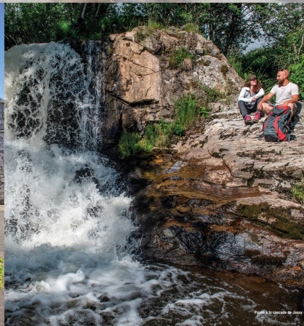
Pause à la cascade de Jassy

de La Roche (éboulis basaltique - 20 min A/R) ; après le hameau du Greil, estive et buron de Marquisat.