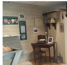
La Maison de la Rose 8