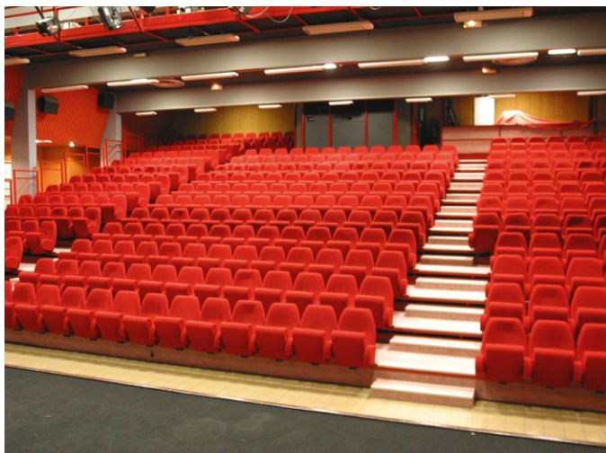
Amphithéâtre de 320 places attenante au Village Vacances