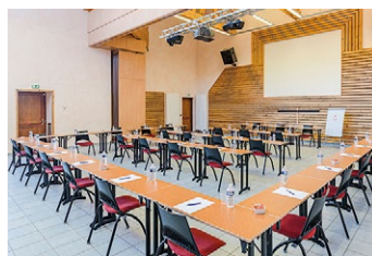
Salle Croix des têtes