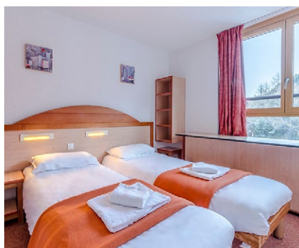
Exemple de chambre