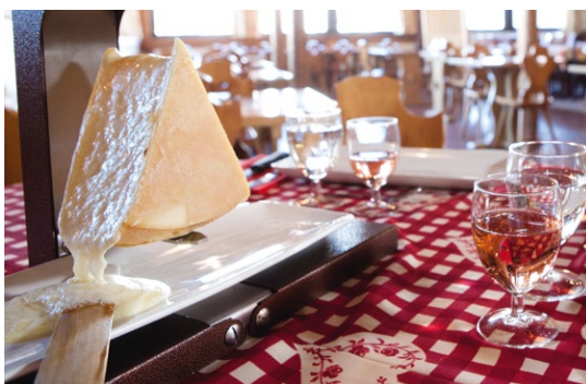
Une gastronomie généreuse, des produits du terroir