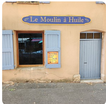
© Moulin à huile - Pontevès