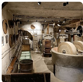
© Moulin à huile - Pontevès