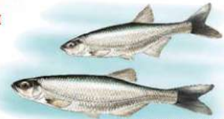
ABLETTES / DESSIN PR.

Cernée par des plateaux qui dominent son cours, la Sioule évolue ici dans un paysage de gorges, avec d'impressionnants viaducs.