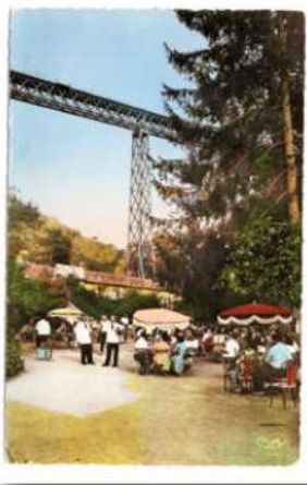
GUINGUETTE SUR L'ÎLE DE ROUZAT

Un pont enjambant la Sioule, un viaduc Eiffel s'élançant dans les airs, une grande prairie dans un cadre verdoyant : on ne pouvait rêver mieux pour créer un site touristique. Dans les années 1950, la mode était aux guinguettes, au camping, aux promenades en barque, en pédalo, et aux fritures au bord de l'eau. Durant une trentaine d'années, la singulière île