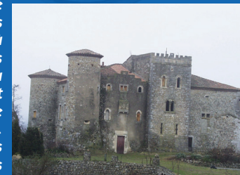
La Bastide avant sa restauration

Le vieux village qui a conservé ses maisons traditionnelles mène à un promontoire d'où l'on découvre les méandres de l'Ardèche et le château de la Bastide qui gardait jadis l'accès au confluent de l'Ardèche et du Chassezac. A cet endroit les fouilles récentes ont mis à jour des vestiges d'une villa gallo-romaine.