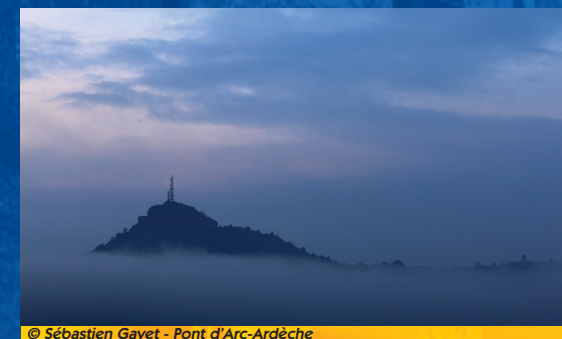
Pont d'Arc-Ardèche

Aux alentours, la Dent de Rez et le Serre de Torre, ont la même structure. D'autres sites plus prestigieux : le Vercors, les Calanques, le Mont Ventoux et les Alpilles où le village d'ORGON (13) a donné l'appellation URGONIEN, sont de la même origine.