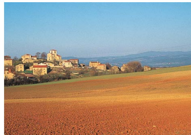
Quand le rouge monte à la terre, du côté de Beaumont.

bifurquer sur le chemin à droite. Continuer tout droit sur 1 km. 3 Tourner à droite sur un autre chemin en direction d'une grande exploitation agricole. Juste avant le ruisseau de Vendage, tourner à gauche et le traverser 500 m plus loin. 4 Suivre la route à gauche sur 100 m et bifurquer à la première piste à droite. Continuer sur cette piste en longeant la déviation sur 1 km. Rejoindre un second chemin. 5 Le suivre à droite, puis à l'intersection suivante, partir à gauche pour longer l'aérodrome jusqu'à la D 194. 6 Couper la route pour prendre le chemin en face ; passer à gauche du réservoir. A la D 19, suivre celle-ci à droite. Traverser le ruisseau de Vendage, puis tourner à gauche pour remonter dans Beaumont ( église romane ).