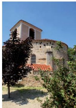
Église romane de Beaumont.

Une balade en terre céréalière, inondée de soleil, où l'arbre n'a pas sa place ; un vaste plateau aux douces ondulations où se sont posés des villages au charme discret ; enfin une piste d'envol pour découvrir le pays d'en haut