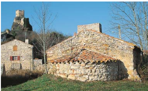
Laroche : en passant près du four banal, on remarque les vestiges perchés du château présenté p. 16.

respirando CHANGÉZ D'AIR... ESSAYEZ LA HAUTE-LOIRE