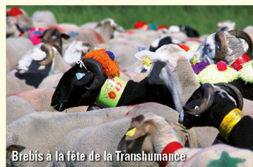
Brebis à la fête de la Transhumance

Sur les 10 000 brebis qui estivent encore sur le massif de l'Aigoual, la moitié traverse l'Espérou à la mi-juin. Dans les vallées méditerranéennes, la nourriture se raréfie sous la sécheresse estivale. Les troupeaux viennent chercher une nourriture encore verte et plus abondante, contribuant par ailleurs à l'entretien des milieux ouverts du massif et à sa diversité paysagère. Il y a un siècle, 60 000 ovins parcouraient les pâturages.