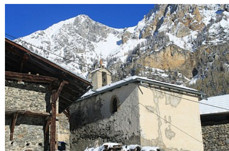
MNPC OT Peisey-Vallandry

Contact : Téléphone : 04 79 07 94 28 Email : info@peisey-vallandry.com Site web : http://www.peisey-vallandry.com