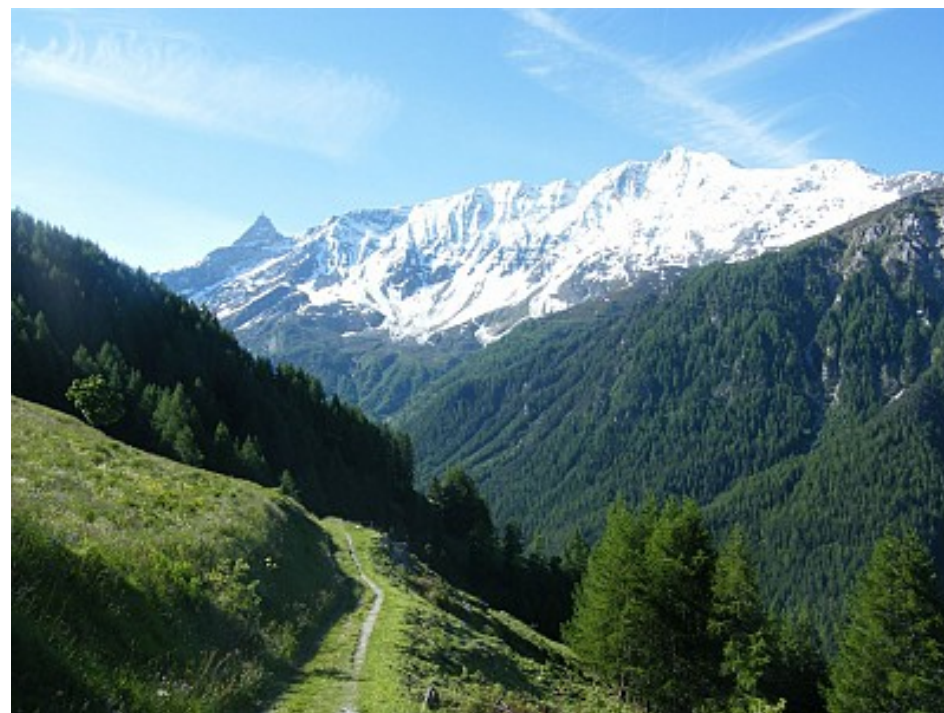
MS- OT Peisey-Vallandry

Vue panoramique sur le massif de Bellecôte, l'Aliet, le site nordique de Pont Baudin et la vallée de Rosuel.