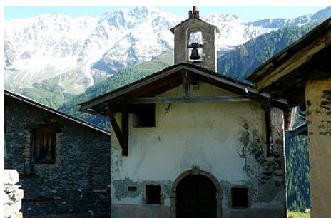
Office de tourisme de Peisey Vallandry

Vous remarquerez la belle serrure de la vieille porte, le bénitier dans la fenêtre, le petit clocher avec sa flèche de tuf.