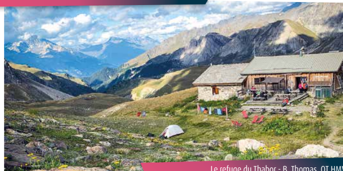
Le refuge du Thabor

Ici un choix s'offre à vous : rester à lézarder au grand air ou parcourir 200 m de dénivellé supplémentaires pour approcher les grands cols du massif du Thabor. Le Cheval Blanc, les Roches, les Sarrazins... et au cœur d'entre-eux, les Bataillères. Qui sait jusqu'où les sifflements des marmottes vous accompagneront ?