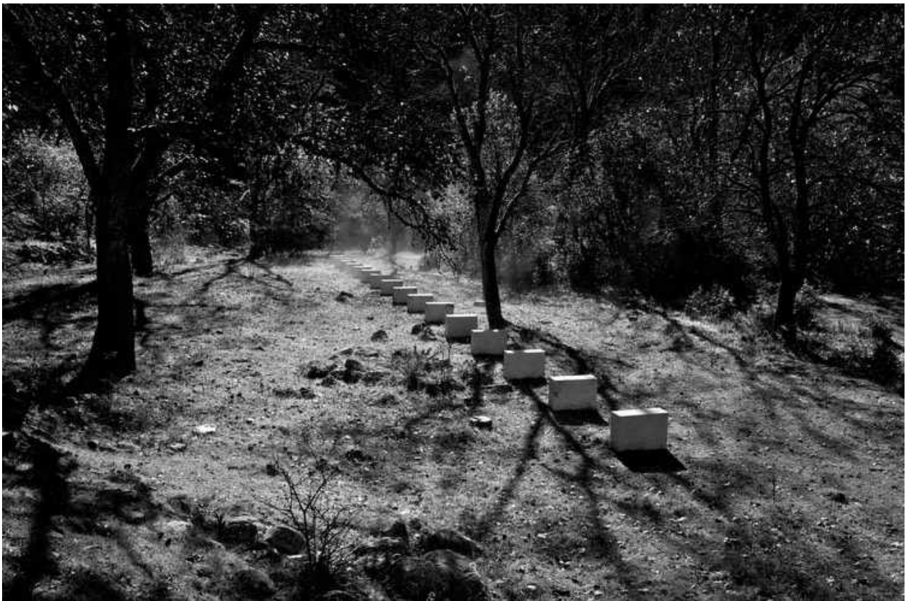
Vière et les moyennes montagnes ©Richard Nonas