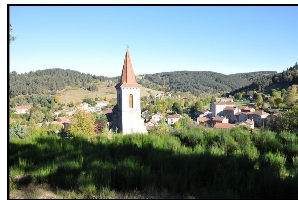
Eglise de Saint-Préjet-d'Allier