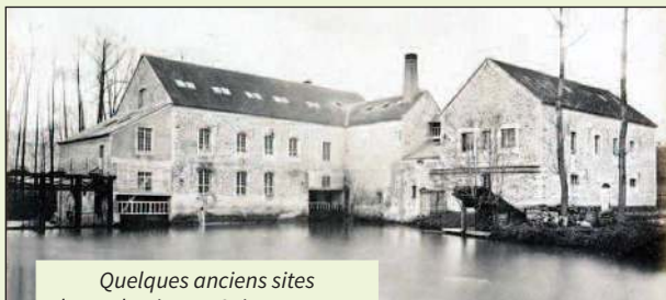
Quelques anciens sites de production en Seine-et-Marne des papeteries du Marais

Depuis, les papeteries du Marais ont fabriqué du papier-monnaie majoritairement pour des pays africains et asiatiques, mais elles ont dû fermer leurs portes, en raison du recul de l'utilisation du papier-monnaie à travers le monde.