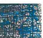
Fragment d'un vitrail d'Elvire JAN, vers 1969