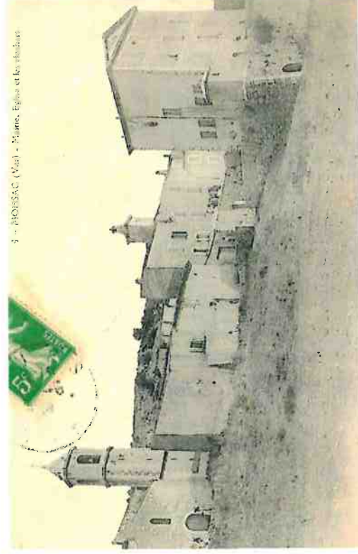
1 - MOISSAC (Var) - Maures, Eglise et Pigeonnier

Parcours d'étroites ruelles dominées par le campanile (XIX ème ) et l'église (XVII ème ), il compte quelques bâtiments des XVI ème et XVII ème . Un peu à l'extérieur se dressent la chapelle XI ème / XII ème ainsi que le pigeonnier et le château (XVII ème ) deux édifices privés remarquablement restaurés.