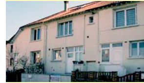
Leur HLM rue du 22 août 1944

allemande) : « Paulette » a pour mission d'y faire sauter les bombardiers au sol.