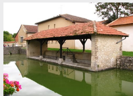
Ancien lavoir de Cologne