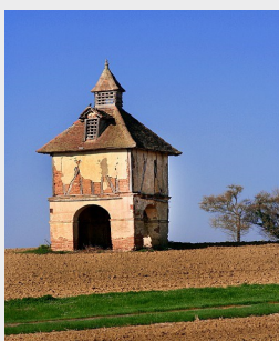
Pigeonnier de type gascon, toit pyramidal à 4 pentes

ot-gascognetoulousaine@orange.fr www.tourisme-gascognetoulousaine.fr