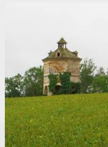
Pigeonnier d'En Guardes, classé aux Monuments Historiques