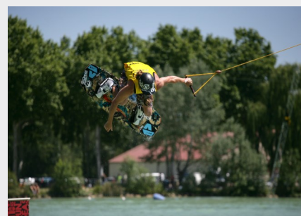
La base de loisirs de l'Isle-Jourdain offre de nombreuses activités aquatiques et de pleine nature