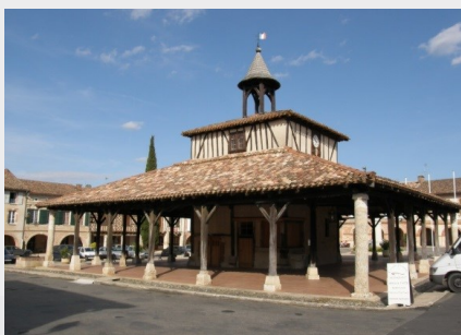
Point central du village de Cologne, cette magnifique halle ne passe pas inaperçue.