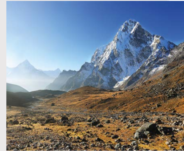
Ama Dablam signifie « reliquaire de la mère » en référence au pendentif en forme d'étoile que portent les Sherpanis (femmes de l'ethnie sherpa).

PROJECTION D'IMAGES L'AMA DABLAM RÉALISATION / MARC ET FLORENCE COTTO ANNÉE 2022 - 15 MIN ÉCHANGES ANIMÉS PAR BENJAMIN GUIGNONNET EN PRÉSENCE DE MARC ET FLORENCE COTTO