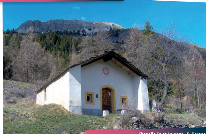
Chapelle Saint-Laurent - R. Bernard

Mais quels sont ces petits casques de couleurs accrochés au-dessus de votre tête ? Ce chemin mène décidément à tous les plaisirs de la montagne ! Les amateurs de via ferrata ne vous contrediront pas. Ces falaises sont aussi un paradis pour le gypaète qui vole souvent par là.