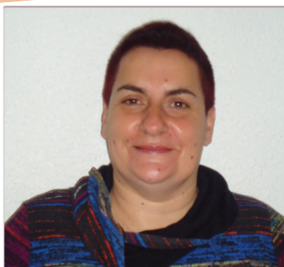
Secrétaire / Agent d'accueil