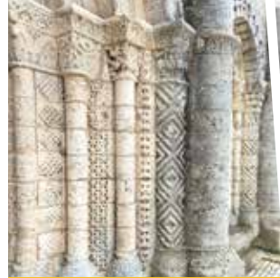
Détail de l'église