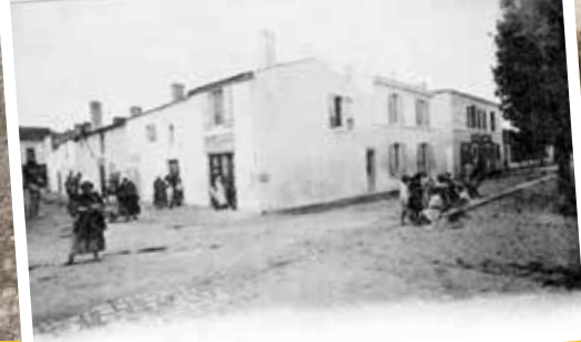
Canton de la Seigneurie