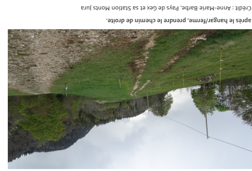
après le hangar/ferme, prendre le chemin de droite.