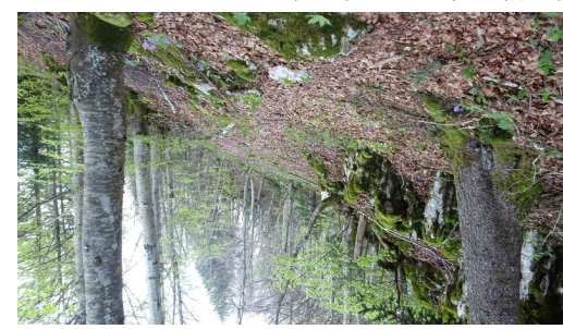
à partir de "La Pelaz", on attaque la montée.

Anne-Marie Barbe Mise à jour: 21.07.2023