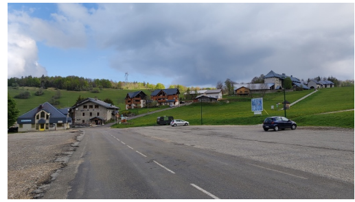
centre de Menthières. ...parking. 1066 m d'alt.

Point d'arrivée de l'activité Menthières