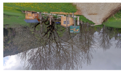
le chemin longe le parcours 'Accro branche' de Menthières.