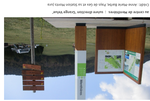
au centre de Menthières : suivre direction "Grange Veuve"