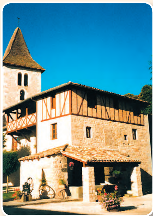
▲ Lavoir, maison de caractère et église très bien restaurés au centre du village de Cayrieich.

A découvrir sur votre chemin : moulin, église, lavoir, pompe à chapelet, pigeonniers et maisons de caractère.