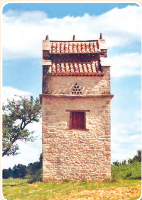
▲ Pigeonnier « ped de Mulet » au Colombier