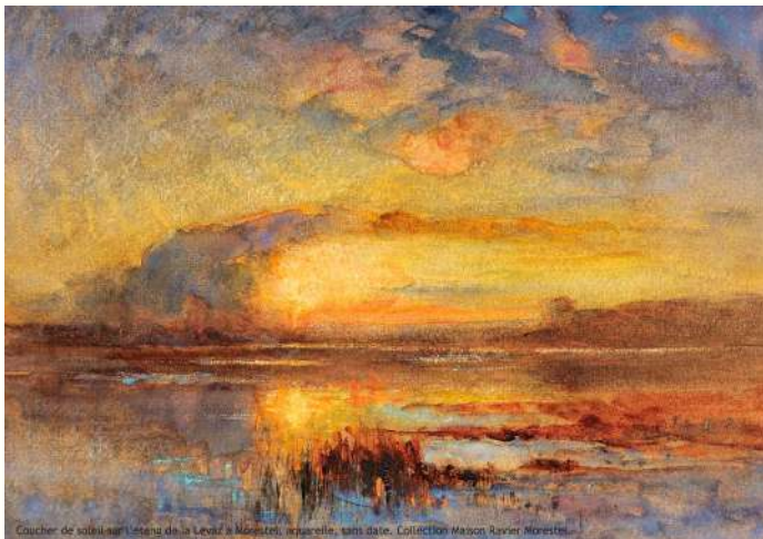
Coucher de soleil sur l'étang de la Levaz - F. A. Ravier

Les offres sont combinables, vous pouvez faire un atelier pédagogique suivi d'une visite commentée par exemple.