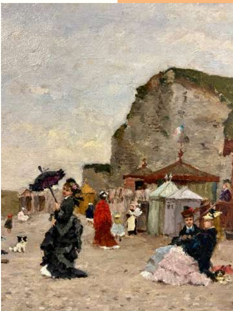
Armand Charnay, Yport, huile sur toile, © Musée de Charlieu