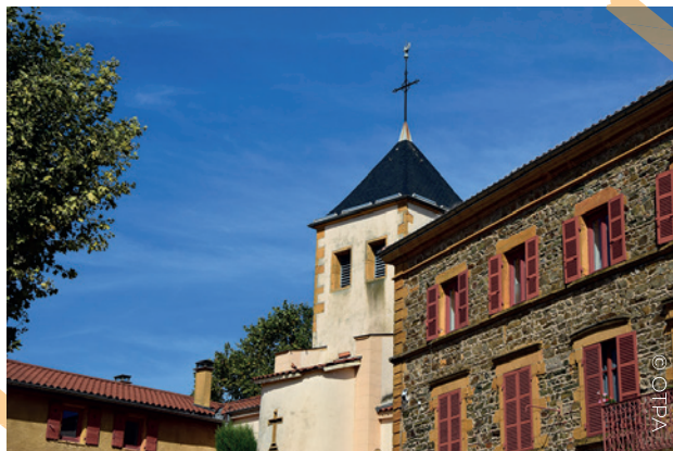
Centre bourg de Fleurieux sur L'Arbresle

5 Au stop, continuez tout droit rue du Poteau. Plus loin au niveau de l'arrêt de bus, prenez à droite la rue Jean Lorme qui monte, puis la montée du Chêne où vous pouvez admirer le Château de Fleurieux devenu école publique, ainsi que les deux pavillons récemment rénovés. Vous arrivez à votre point de départ : l'église de Fleurieux, puis l'espace François Baraduc.