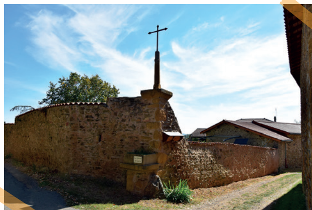
hameau de Lévy

Aux portes de Lyon, Fleurieux-sur-L'Arbresle est un condensé de ce que l'agriculture peut offrir dans sa plus grande diversité. Des activités qui façonnent les paysages que vous aurez plaisir à découvrir tout au long du circuit.