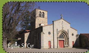
Église St Cyr