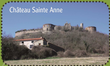
Château Sainte Anne