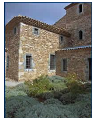
Cellule témoin entièrement reconstruite