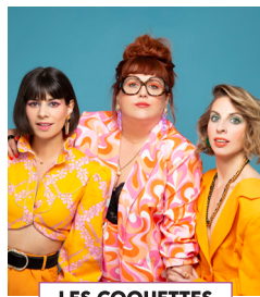
LES COQUETTES Humour musical

Rendez-vous samedi 7 septembre à 20h30 pour la présentation de la programmation complète