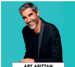
ARY ABITTAN Humour