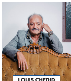
LOUIS CHEDID Concert