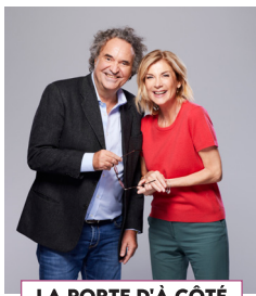
LA PORTE D'À CÔTÉ Théâtre