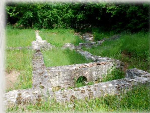
La cave aux Fées

La vallée du Lunain traverse le Bocage Gâtinais jusqu'à Moret-sur-Loing. Paley, au carrefour de deux voies romaines, dresse son donjon sur un site autrefois consacré au dieu Mercure.