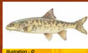
Illustration : ©

Chez les poissons, le barbeau méridional a développé une tolérance inédite à l'augmentation de la température de l'eau et à la raréfaction de l'oxygène qui se produisent en été. Il résistera à l'assèchement partiel de la Ligne.