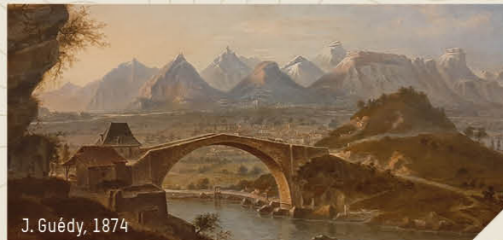
J. Guédy, 1874

Sur votre droite, le pont Lesdiguières est une construction du début du XVIIe siècle qui permet de relier Claix à la nouvelle commune de Pont-de-Claix, par-dessus le Drac. Cet édifice, initié par François de Bonne, futur Duc de Lesdiguières, est considéré comme l'une des 7 merveilles du Dauphiné. Quelles sont les six autres ?