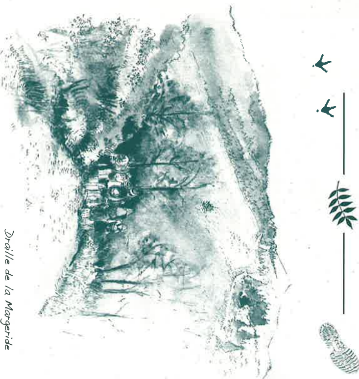
Draille de la Margeride