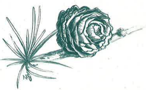
Pive du Mélaize

Les Cévennes sont également marquées par de grandes forêts de pins et de sapins issues du reboisement. On dit ces forêts artificielles parce que les forestiers