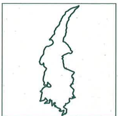
Boucle n° 4

Pour aller plus loin, lire le « Guide du naturaliste Causses-Cévennes » Libris, 336 pages.